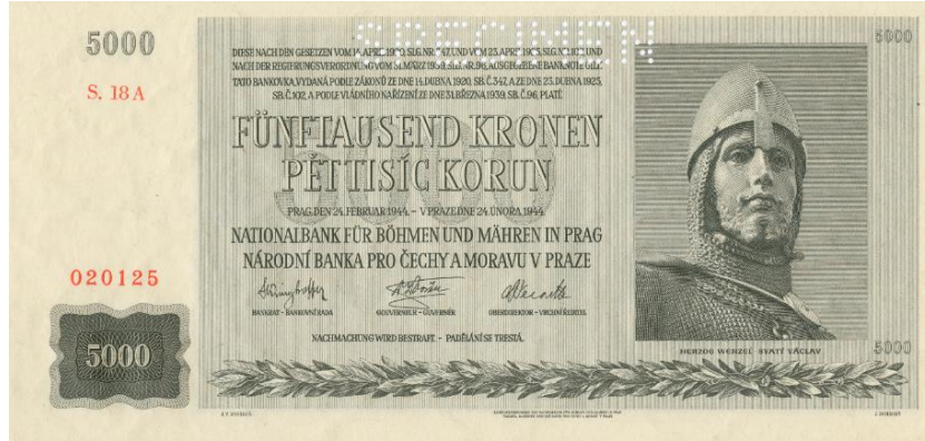
5000 K, 1944, líc