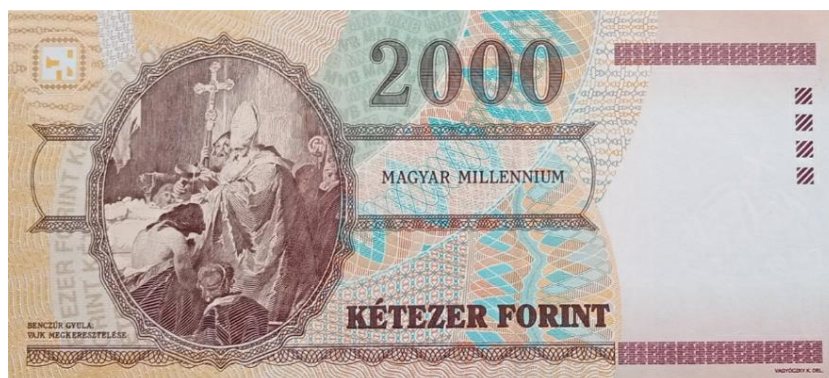
2.000 HUF, pamětní bankovka, rub