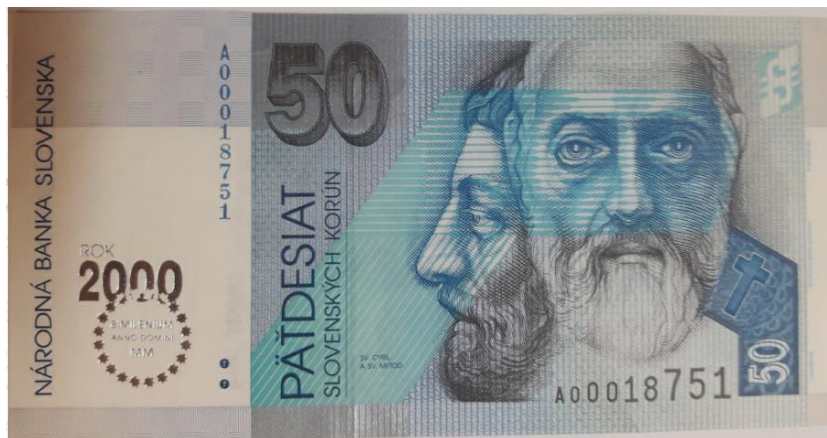
150 SK, 1993 (1999), líc