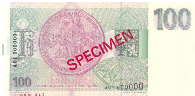
100 Kč, 1993, rub