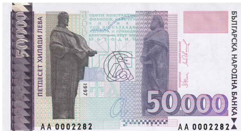
50.000 BGL, 1997, líc